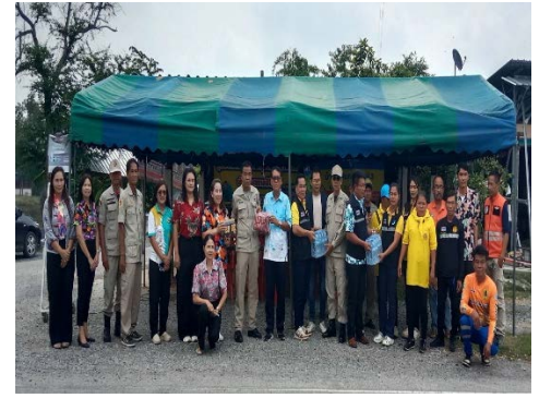
รูปถ่าย ดำเนินงานโครงการในแผนพัฒนาห้าปี (ปี ๒๕๖๘)/โครงการตามข้อบัญญัติที่เบิกจ่ายแล้ว ขององค์การบริหารส่วนตำบลโนนข่า