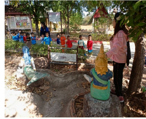
รูปถ่าย ดำเนินงานโครงการในแผนพัฒนาห้าปี (ปี ๒๕๖๘)/โครงการตามข้อบัญญัติที่เบิกจ่ายแล้ว ขององค์การบริหารส่วนตำบลโนนข่า