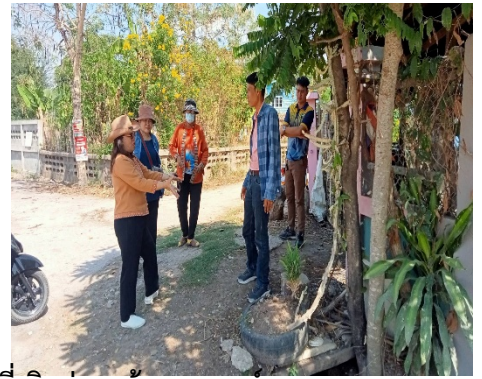
รูปถ่าย ดำเนินงานโครงการในแผนพัฒนาห้าปี (ปี ๒๕๖๘)/โครงการตามข้อบัญญัติที่เบิกจ่ายแล้ว ขององค์การบริหารส่วนตำบลโนนข่า